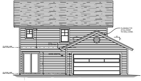
EAST ELEVATION 1