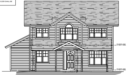
WEST ELEVATION 1